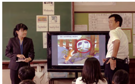
授業例も多数ご紹介(講義映像より)