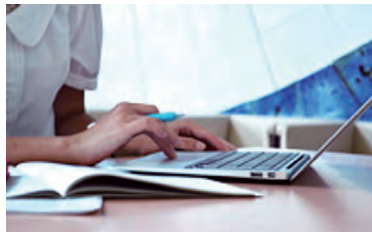
隙間時間にも効率的に学習できます