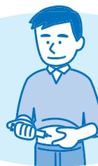
インスリンの投与量の調整