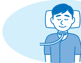
気管カニューレの交換