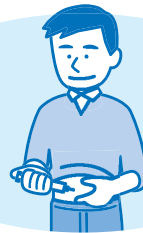
インスリンの投与量の調整