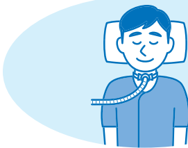
気管カニューレの交換