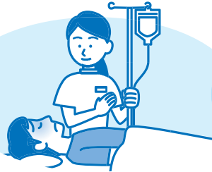
脱水症状に対する輸液による補正